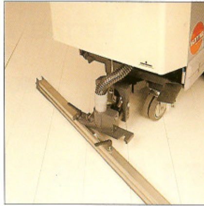
Der breite, weit ausschwenkende Saugfuß läßt auch in Kurven kein Wasser zurück.